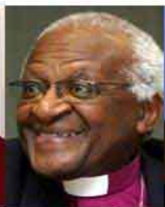
Desmond Tutu Pace 1984