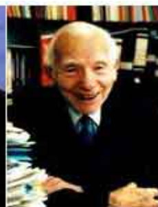
Joseph Rotblat Pace 1995