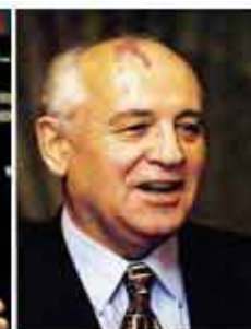
Mikhail Gorbachev Pace 1990