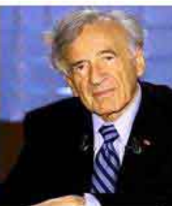
Elie Wiesel Pace 1986