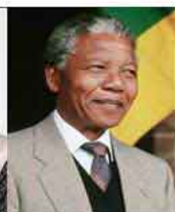
Nelson Mandela Pace 1993