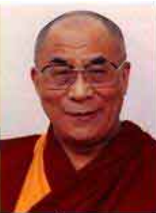
Dalai Lama Pace 1989